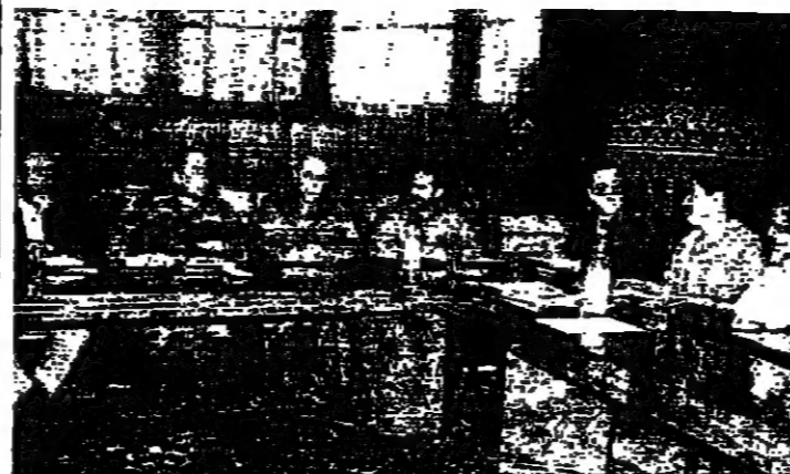
اللجنة الامنية في اجتماعها امس